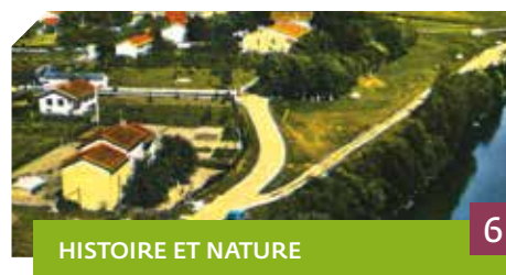
HISTOIRE ET NATURE