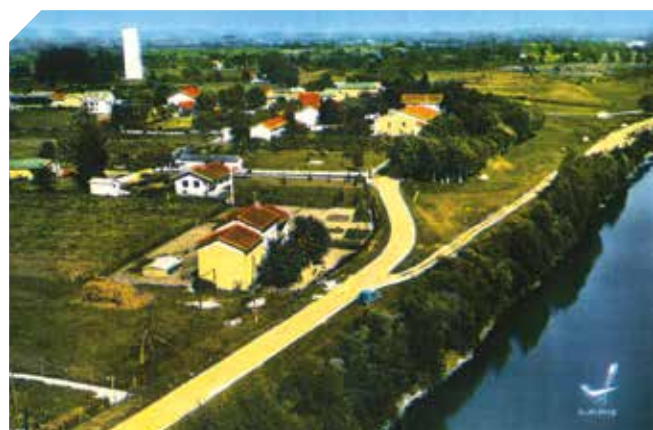
▲ Les carrières de Thil (au fond à droite)

La faune piscicole des deux plans d'eau est aujourd'hui diversifiée. Les pêcheurs Thilois peuvent donc capturer de nombreuses espèces de poissons. Parmi les carnassiers, la perche commune a les effectifs