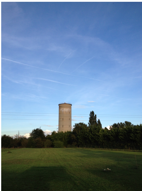
Le périmètre éloigné est constitué par l'aire géographique délimitée par la route de Niévroz, la rue Neuve/Route de Montluel et le Chemin du Poteau.